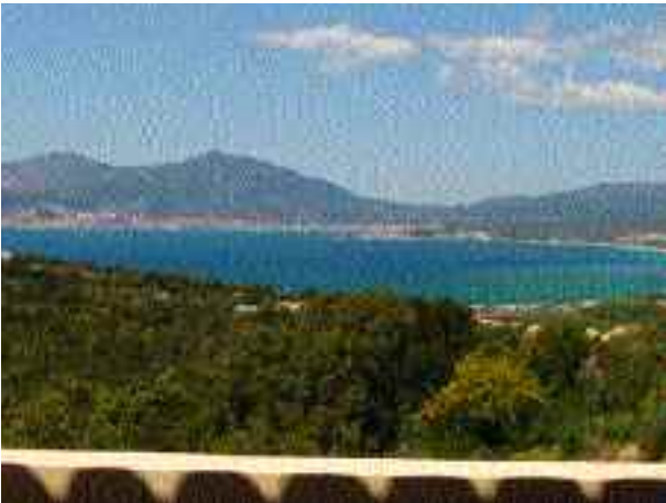
De la pièce principale et de la terrasse, vue exceptionnelle sur toute la baie d'Ajaccio et les îles sanguinaires.