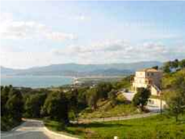
La villa est située au calme, dans un quartier résidentiel, à 2 mn de la plage de Porticcio, de ses activités balnéaires et de ses commerces. Villa lors de la mise en crêpi, Mars 2001.