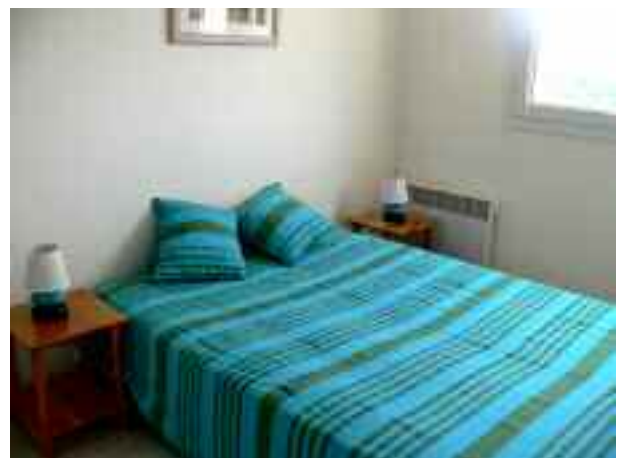
L'une des 4 chambres. Celles-ci donnent toutes sur la baie d'Ajaccio et sont équipées d'un grand placard de rangement.