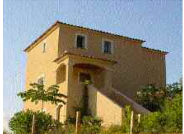
Dominant la baie d'Ajaccio, cette grande villa de près de 120 m 2 de surface de vie habitables.