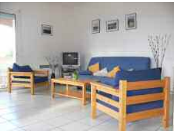
Salon avec canapé amovible, coin télévision.